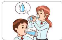
1 물을 자주 적당히 마신다.