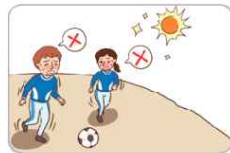
3 머운 시간대에 휴식을 취한다.(운동장 등 실외활동을 자제한다.)