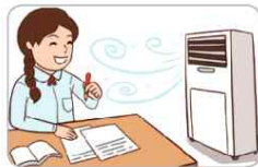
2 시원하게 자낸다.